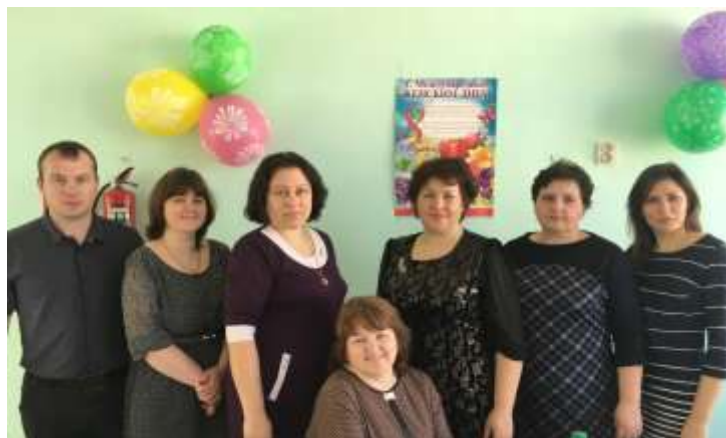
Члены профсоюзного комитета

За данный период профсоюзным комитетом проведено 6 заседаний в соответствии с планом работы.