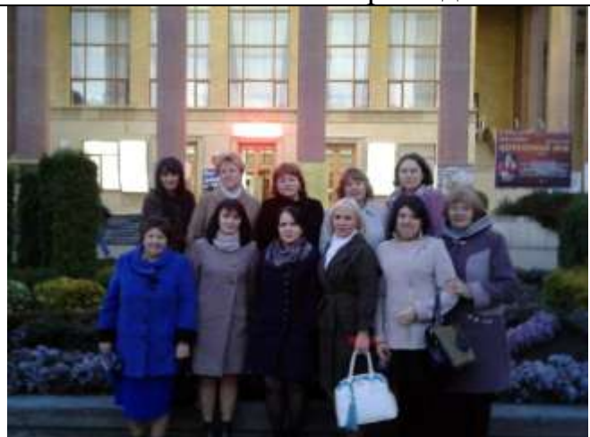
Драматический театр. Г.Ставрополь

Был организован выезд в село Донское для просмотра спектакля «Мастер и Маргарита», в город Ставрополь в Драматический театр на спектакль «Тетки». 32 члена коллектива посмотрели данный спектакль.