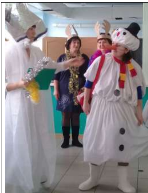
Прибытие «Снежной королевы»