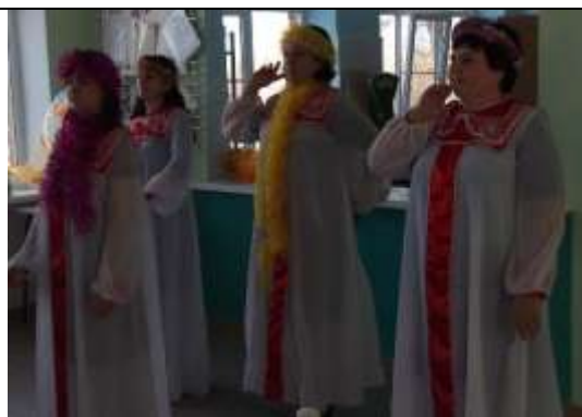
Поздравляем коллектив с Новым годом: и поем, и пляшем, и играем!